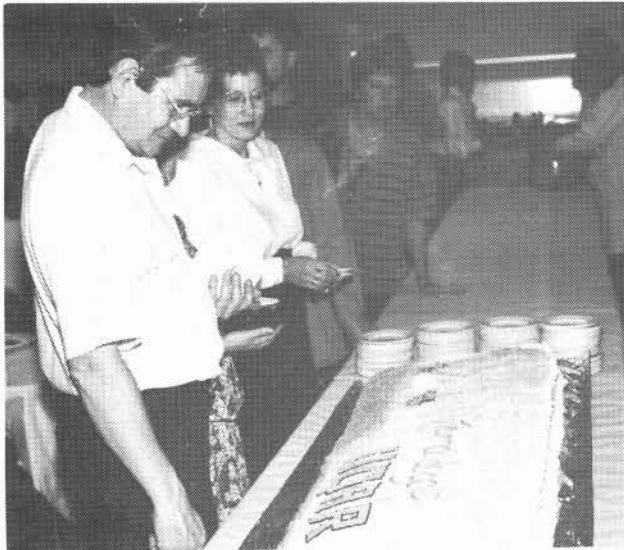
Quelques-uns se sont empressés de réserver leur portion de gâteau. Au cas où...