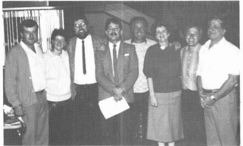
Le comité organisateur de ce Tournoi de golf. La chaleur de leur entrain a embué la lentille de l'appareil-photo...