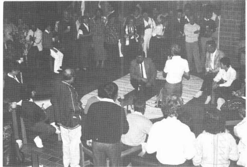
La course des petits chevaux: Blue Bonnets commence à craindre la compétition féroce...