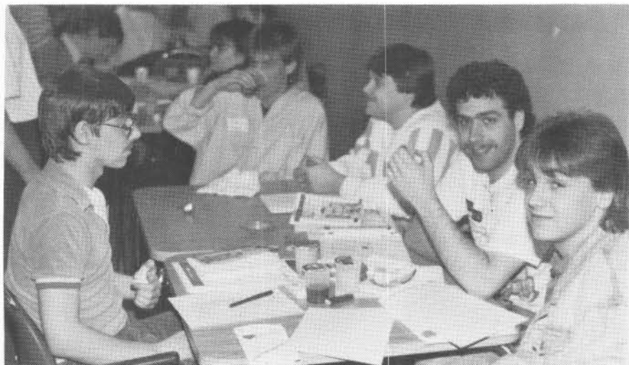
Quelques-uns des étudiants-es des cégeps de la région, en visite à l'UQAR dernièrement.