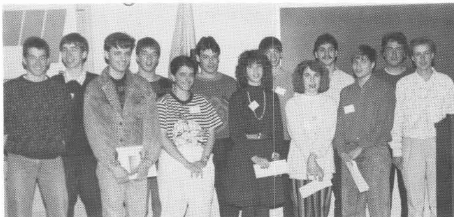
Voici les principaux gagnants et gagnantes de l'Expo-sciences régionale. Ces jeunes iront prochainement défendre leurs projets à l'Expo-sciences provinciale, qui aura lieu à Montréal.

printanier qui a circulé dans nos murs, en dépit du mauvais temps à l'extérieur.