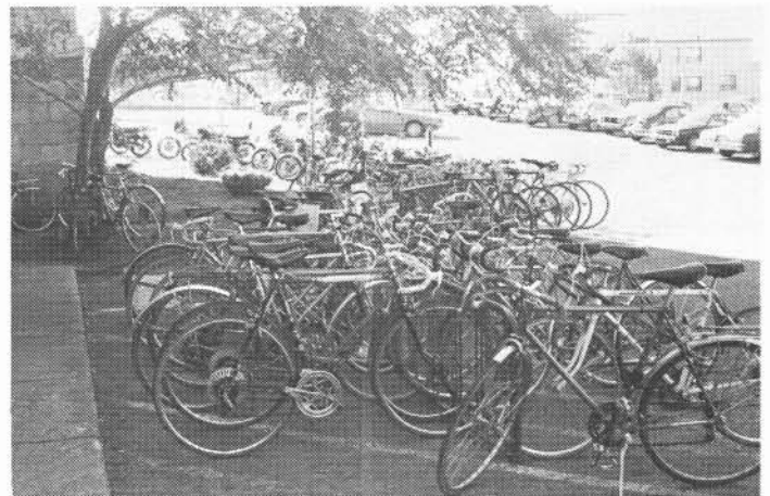
Un club d'utilisateurs de véhicules à deux roues: ce serait sans doute une initiative qui s'attirerait de la popularité à l'UQAR.

Pour ceux et celles qui s'intéressent à l'éducation à la santé et à la médecine préventive, un important congrès de la Société de médecine préventive se déroulera à Québec, à l'hôtel Concorde, du 20 au 24 octobre prochain. On y parlera des comportements à l'égard de la santé, de l'influence de l'environnement sur la santé et de modifications des habitudes de vie. Plus de détails à 656-5926, à Québec.