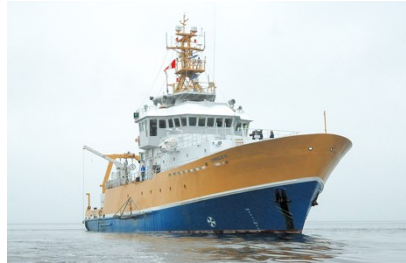
Navire de recherche Coriolis II, ISMER