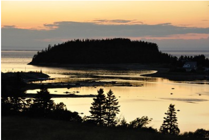
Parc national du Bic, Guillaume Cattiaux