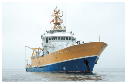
Navire de recherche Coriolis II, ISMER