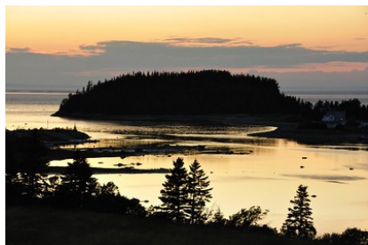
Parc national du Bic, Guillaume Cattiaux