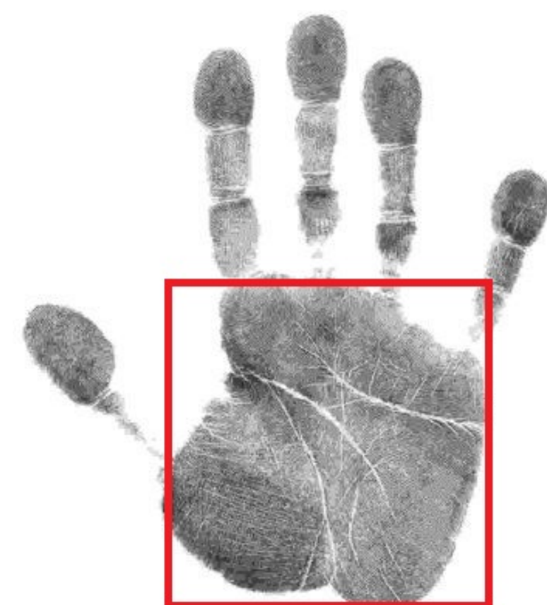
FIGURE 2 – Exemple d'empreinte palmaire