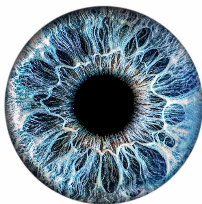
FIGURE 1 – Exemple d'iris humain

Ces deux modalités représentent des identifiants uniques pour chaque individu.