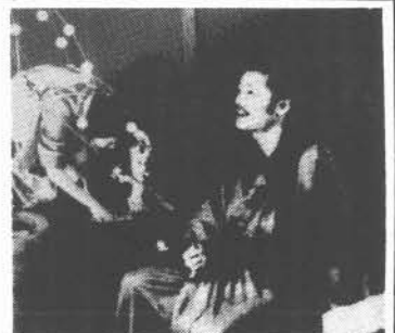
L'EMPIRE DES SENS

Ce soir, un drame de moeurs, L'ETAT SAUVAGE.